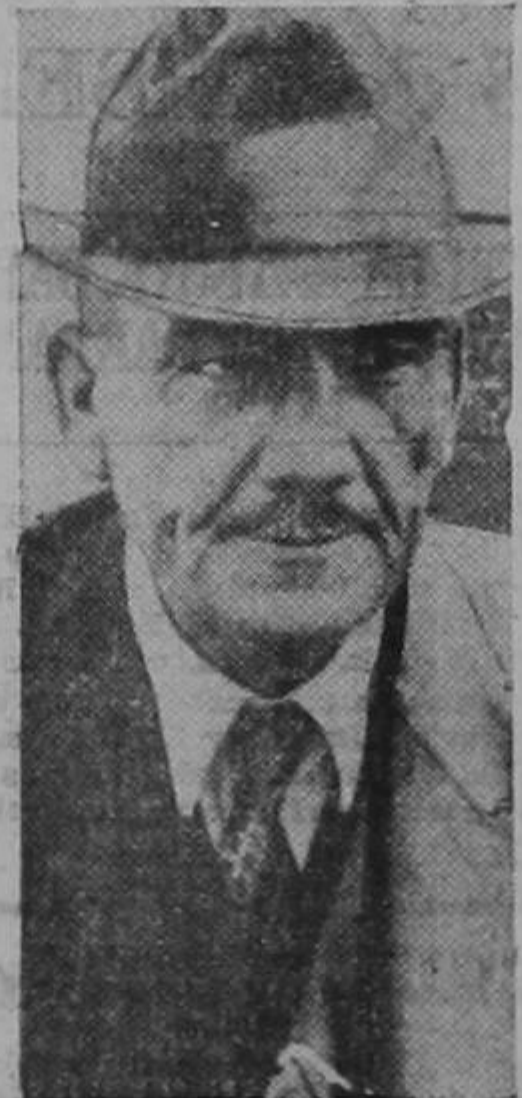
GENERAL PLUTARCO ELIAS CALLES

en autoridad. Conducido esta mañana a la agencia de policía, manifestó que no sabe cómo pudo suceder eso, pues ha sido uno de los más entusiastas partidarios de don León; agrega que se encontraba en completo estado de ebriedad.